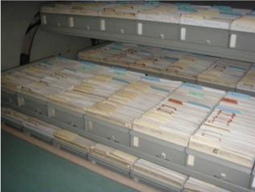
Abb. 1 : Blick in einen Kartei-Lift des ZKBW