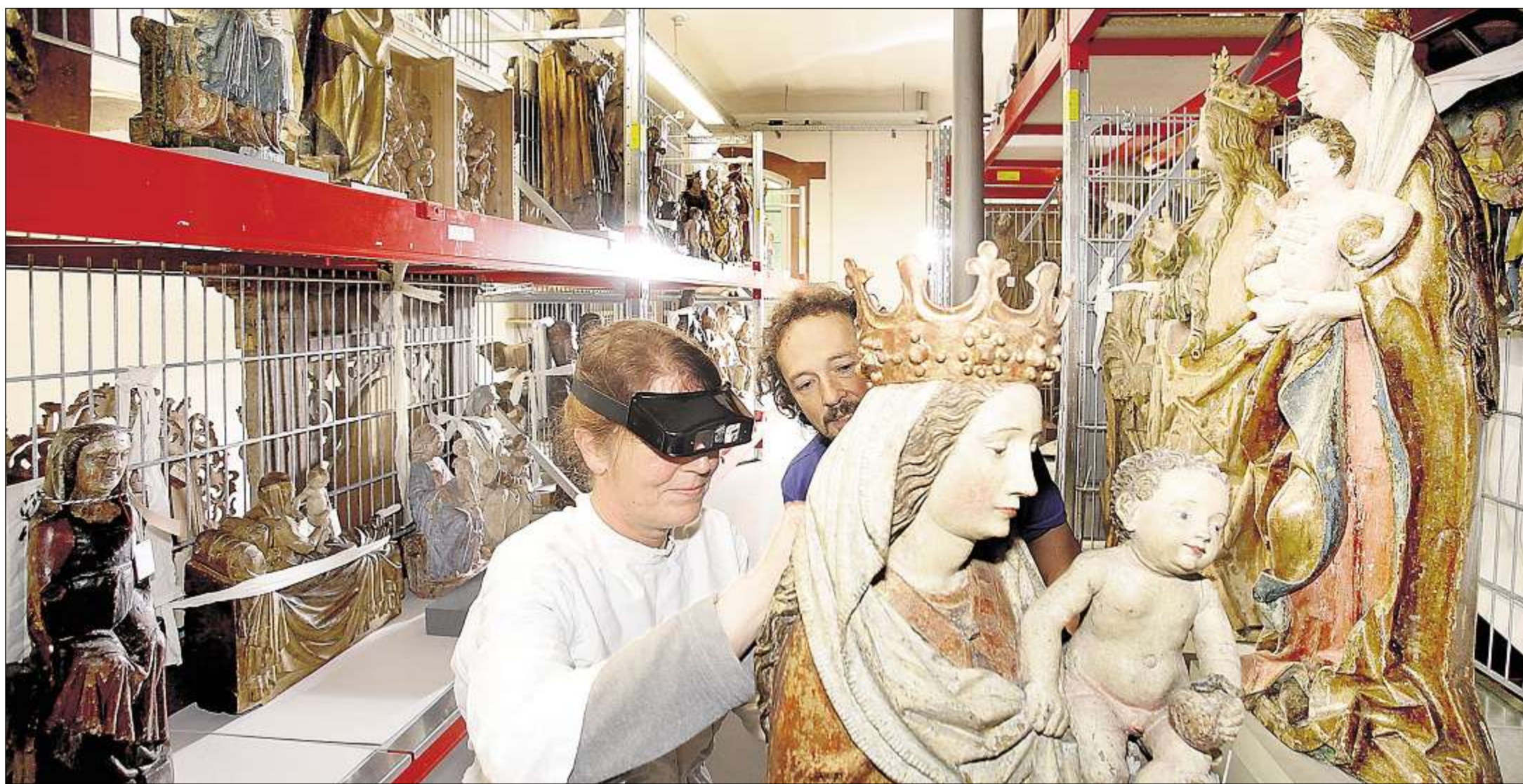
BESTANDSPFLEGE: In den Depots des Badischen Landesmuseums schlummern Tausende Kunstwerke, die aktuell nicht in Ausstellungen gezeigt werden. Auch im Depot verwahrte Kunst wird nach ihrer EDV-Erfassung im digitalen Bestandskatalog des Museums präsentiert. Derzeit sind online aber erst rund 300 Kunstwerke eingestellt. Insgesamt verfügt das Landesmuseum über 330 000 Objekte.

Für das elektronische Nachschlagewerk müssen zunächst die Museumsbestände EDV-technisch erfasst werden. „Dafür ist bei uns