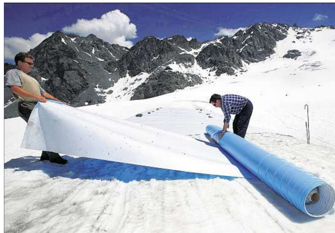
FOLIENSCHUTZ VOR SCHMELZE: Die Alpengletscher gehen regelmäßig bei jeder Erwärmungsphase zurück. Ist diesmal das vom Menschen verursachte Kohlendioxid schuld am Abtauen?

Die digitalen Kataloge dieser Museen sind vereint zu finden unter der Internetadresse http://musis.bsz-bw.de/